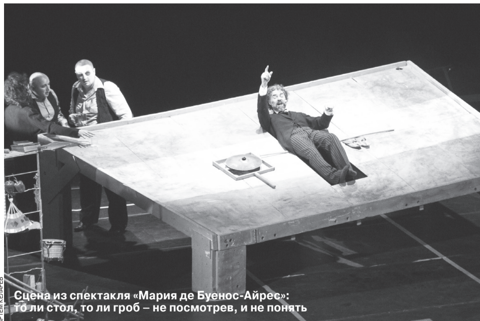
Сцена из спектакля «Мария де Буэнос-Айрес»: то ли стол, то ли гроб – не посмотрев, и не поняв